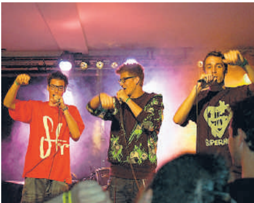
Soundsgood klangen nicht nur gut, sie überzeugten auch mit einer aktionsgeladenen Bühnenshow. GUEZ

Rund 180 Personen liessen es sich nicht nehmen, den jungen Talenten im Jugendzentrum Planet Z und im OX ihre Unterstützung zu bekunden, sei dies von der jüngeren Generation mit sportlichem Mittanzeln, oder das eher besinnliche Zuhören mit anschließendem tosenden Applaus seitens der etwas gesetzteren Zuschauer.