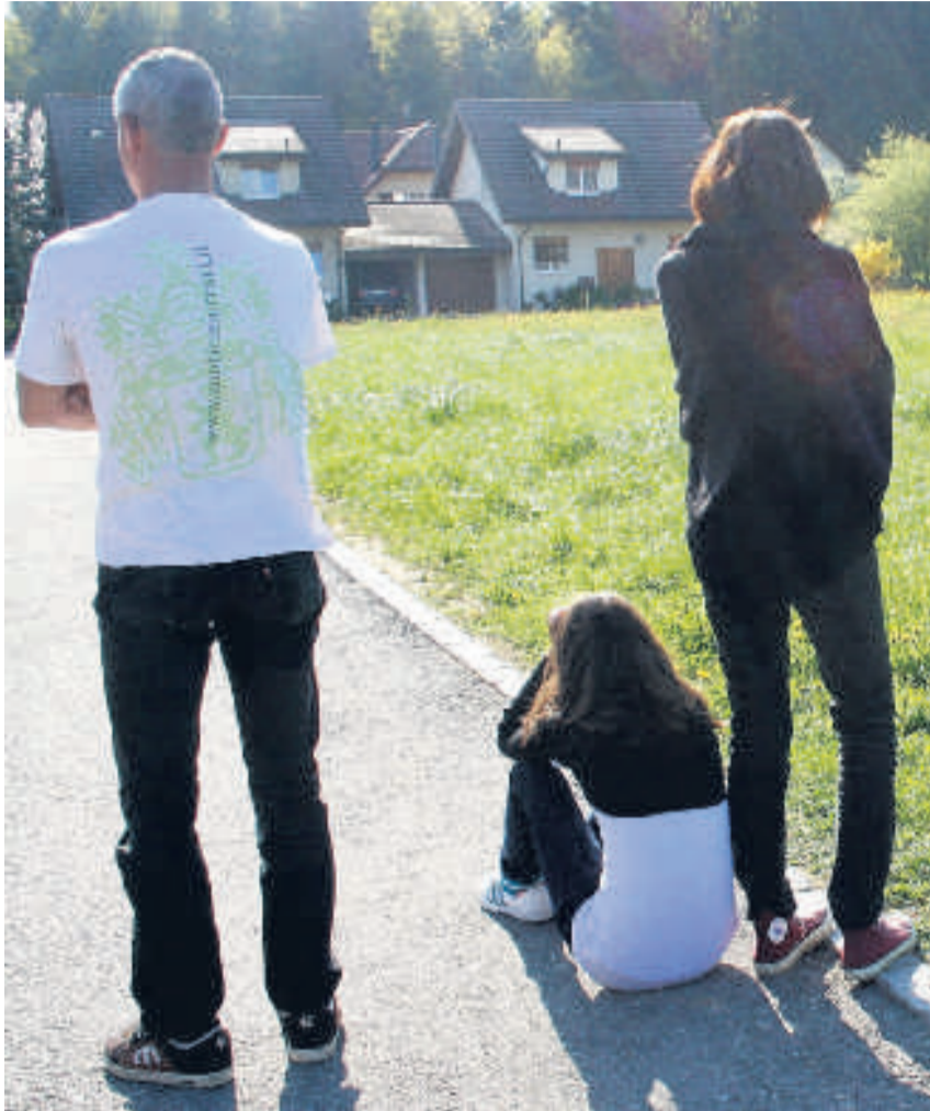
Wenn sich die Eltern nichts mehr zu sagen haben, hilft der Verein BBT, damit die Kinder den anderen Elternteil weiterhin sehen können.